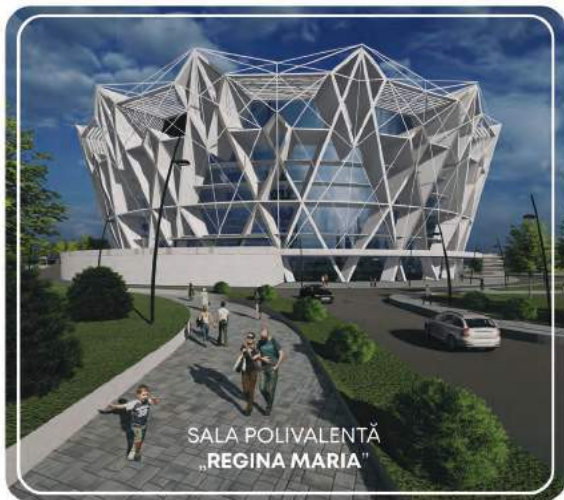
SALA POLIVALENTĂ „REGINA MARIA”